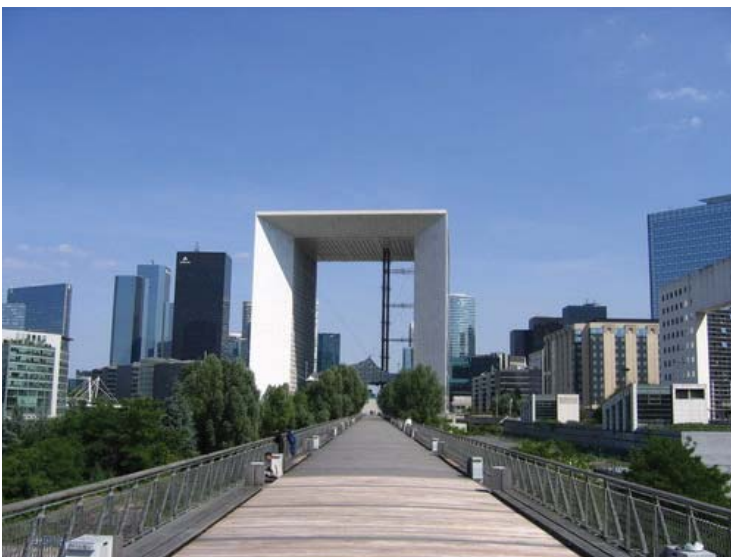
Paysage-rue 4 : La Défense