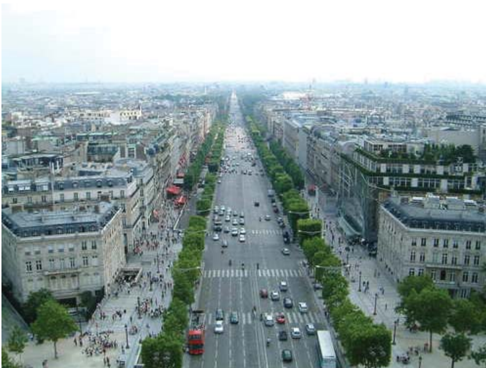
Paysage-rue 1 : Les Champs-Élysées