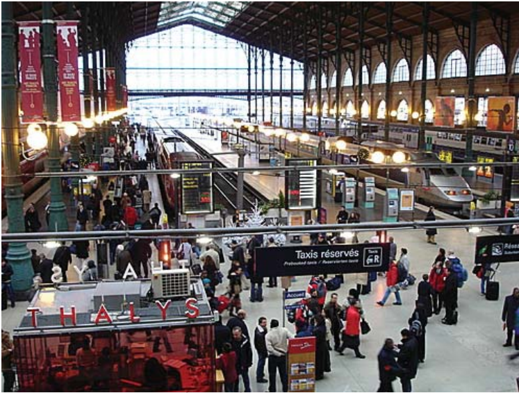
Paysage-rue 2 : La gare du Nord