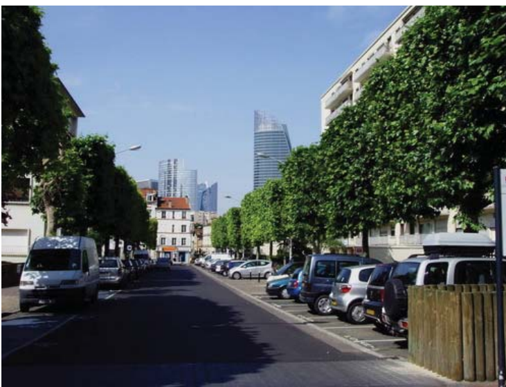
Paysage-rue 3 : Courbevoie, rue Paul Napoléon Roinard.